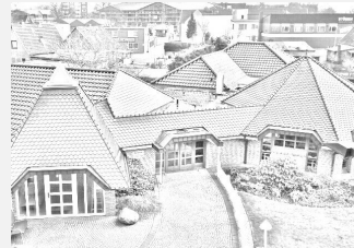
eigene Trauerhalle in Kaltenkirchen mit Parkmöglichkeit

Im Dunkeln nach Hause kommen und erst nach Aufschließen der Haustür Licht machen zu können, ist eine Vorststellung, die viele besonders ältere Frauen daran hindert, nach Einbruch der Dunkelheit noch außer Haus zu sein. Eingebaute Bewegungsmelder schalten das Licht wo immer Sie wollen. Dies ist auch ein Schutz vor unerwünschten Besuchern. Fragen Sie bei örtlichen Anbietern nach einem Einbau an.